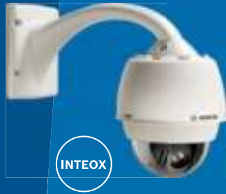
AUTODOME inteox 7000i

Откройте, проверьте и глубоко изучите НОВЫЙ МИР ВОЗМОЖНОСТЕЙ