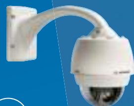
MIC inteox 7100i