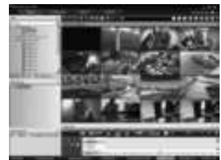
Клиентская рабочая станция