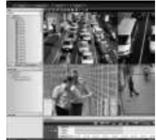
Клиентская рабочая станция