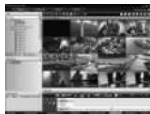
Клиентская рабочая станция