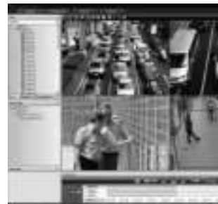
Клиентская рабочая станция